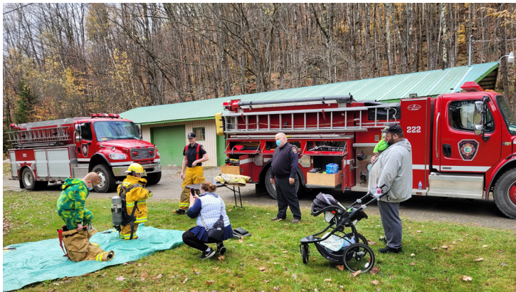
Photo: On October 30th, we hosted a Fall Festival! Lots of good interactions and fun with the visitors like with the local fire department who came by for a visit.

Pray and participate in our funding campaign to raise an additional $2,500/month in monthly giving this year. Monthly giving helps us plan for the future. The increase this year will help us reach more children and youth with year-round camps.